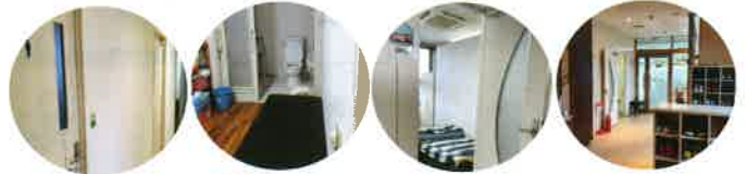
男子便所・女子便所 身障者用トイレ・ベットのシャワールーム完備 安静室 玄関