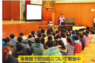
体育館で認知症について勉強中

南第一地区では4年前より「認知症安心声かけ訓練」を実施しています。「認知症安心声かけ訓練」では、たとえ認知症になっても、住み慣れた地域で安心して暮らしていくことができるよう、地区福祉委員が主体となって、認知症についての啓発や、認知症の人に対しての関わり方を学んでいます。また2年前からは、地区福祉委員と一緒に南第一小学校の6年生も参加、学習しています。高齢者の4人に1人が認知症、もしくは認知症になるかもしれない時代です。「認知症の人にとってやさしいまちは、みんなにとってもやさしいまち」という南第一小学校の校長先生の言葉を胸に、認知症になっても安心して暮らせる大阪狭山市を、これからもみなさんと一緒につくっていききたいと思えます。