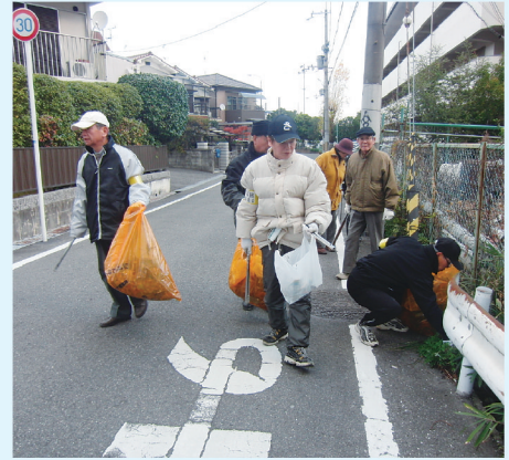
狭山地区福祉委員会

ごみの落ちていないまちを目指して、地域内（狭山地区周辺）の清掃活動を実施しています。清掃活動を始めたきっかけは、大阪狭山市駅に続く歩道に「タバコのポイ捨て」が目立つようになったことを、地域福祉活動実施計画のグループワークで議論しました。