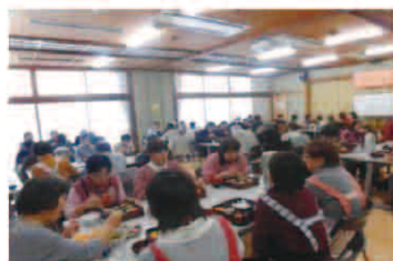
一人暮らし老人会食会

赤い羽根共同募金は、地域福祉の推進を目的に「社会福祉法」に基づいて、今年度も10月1日から全国一斉に展開されています。皆様からお寄せいただいた寄付金は、大阪狭山市内の社会福祉施設や社会福祉団体、地域の福祉活動に役立てられます。