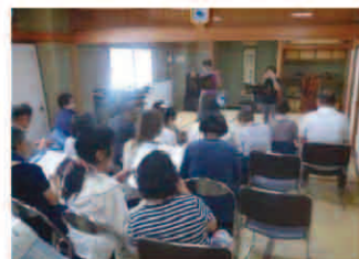
小地域ネットワーク活動

※この他にも、災害時には「災害ボランティアセンター」の設置・運営など、様々な事業に共同募金は役立てられています。