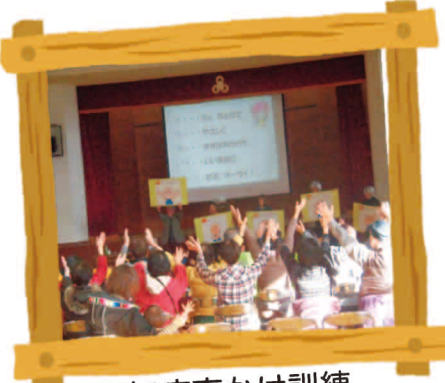
認知症声かけ訓練