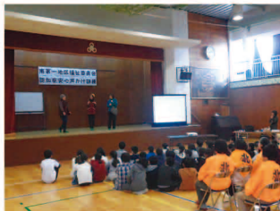
認知症安心声かけ訓練 (福祉協力校事業)