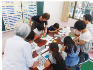
ジュニアスクール (ボランティア活動)