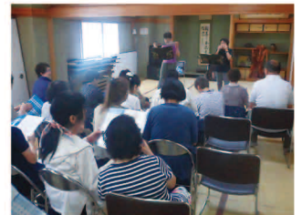
サロン活動 (小地域ネットワーク活動)