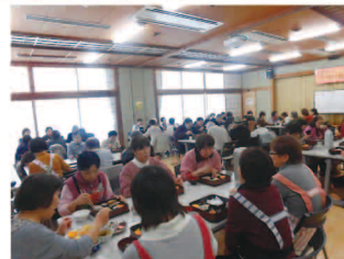
ひとり暮らし老人会食会