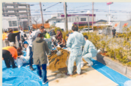
(土のうづくりの研修)