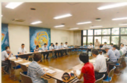
(令和元年度の定例会)