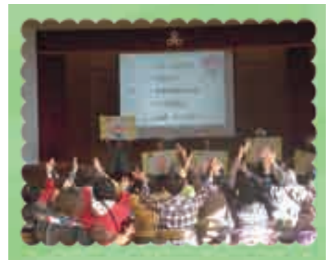
認知症声かけ訓練