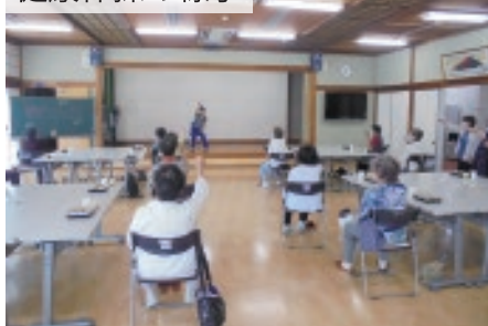
さつき荘での配食の様子